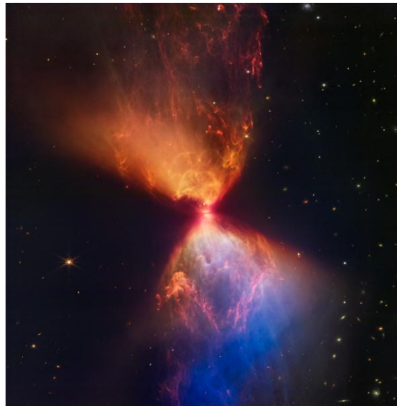
Image de la protoétoile L1527, observée par le JWST, en cours de formation par l'effondrement d'un nuage moléculaire dans la constellation du Taureau. Un disque protoplanétaire est en train de s'assembler ; c'est dans ce disque que se forment les minéraux du futur système planétaire.

Ce cadre permet de faire émerger trois grands types d'assemblages minéralogiques seulement, en accord avec les trois grandes familles de météorites connues dans le Système solaire. La diversité des matériaux planétaires ne résulterait donc pas nécessairement de variations de composition à grande échelle dans la nébuleuse solaire, mais pourrait s'expliquer, en grande partie, par des conditions locales de formation — en particulier par la rapidité des épisodes de refroidissement., ce qui témoigne de leur formation dans une nébuleuse solaire agitée de mouvements violents et d'épisodes de chauffage intenses dans les premiers cent mille ans.